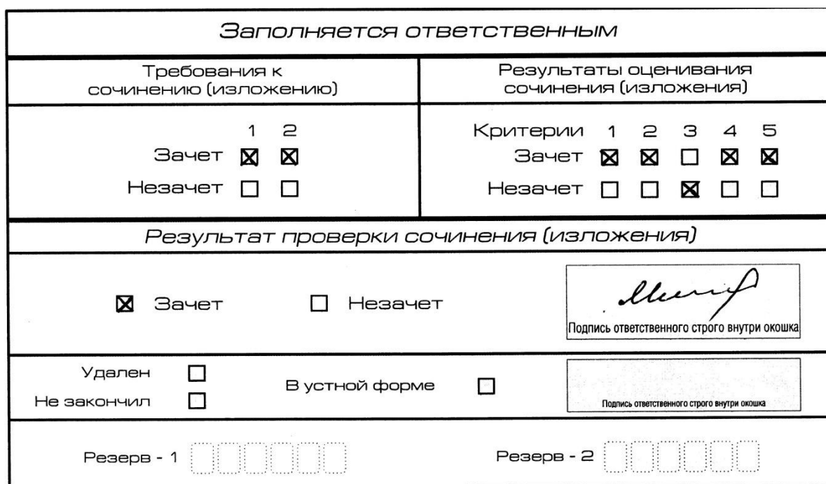
Рис. 10. Область для оценки работы

3. Во всех остальных случаях итоговое сочинение (изложение) проверяется по всем пяти критериям и оценивается по системе «зачет»/«незачет».