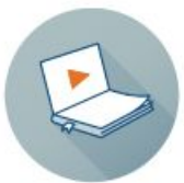
Видеоуроки от ИнтернетУрок