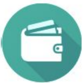
Основы финансовой грамотности