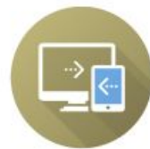
КПК «Цифровая образовательная среда»